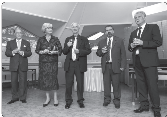
Marék Veronika meséjének a 70-es évek második felében készült 26 részes rajzfilmsorozata

Az adományozott hangszer kottatartójára egy kedves kabalát tettek, a kockásfülű nyúl figurát.