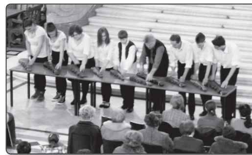
A Kispesti Citeraegyüttes