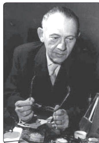
Lajtha László 1892. 06. 30.-1963. 02. 16.