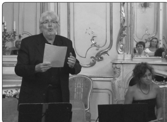
Az EXCANTO Együttes - Keszthely 2012

ban régi zenét énekel, szinte mindenki volt az ő növendéke. Neki támadt az az ötlete – mivel nagyon hosszú ideje voltunk kollégák, és sokat is énekelünk együtt –, hogy én, aki vezényléssel