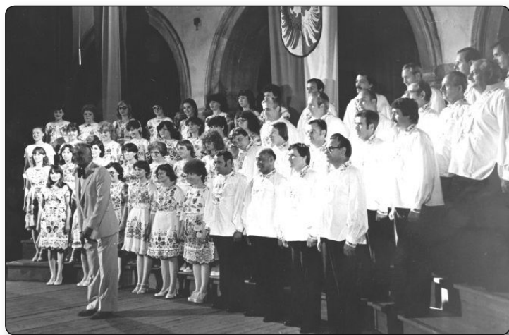
1981 Spittali Nemzetközi Verseny

akkori szocialista államok mellett Belgiumban, Svájcban, Ausztriában, Írországon és Walesben is megfordult – az utóbbi helyszínen rendezett 1978-as Llangollen-i Nemzetközi Kórusverse-