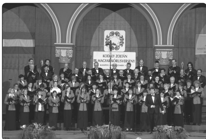
2003 Kodály Zoltán Magyar Kórusverseny

akkori szocialista államok mellett Belgiumban, Svájcban, Ausztriában, Írországon és Walesben is megfordult – az utóbbi helyszínen rendezett 1978-as Llangollen-i Nemzetközi Kórusverse-