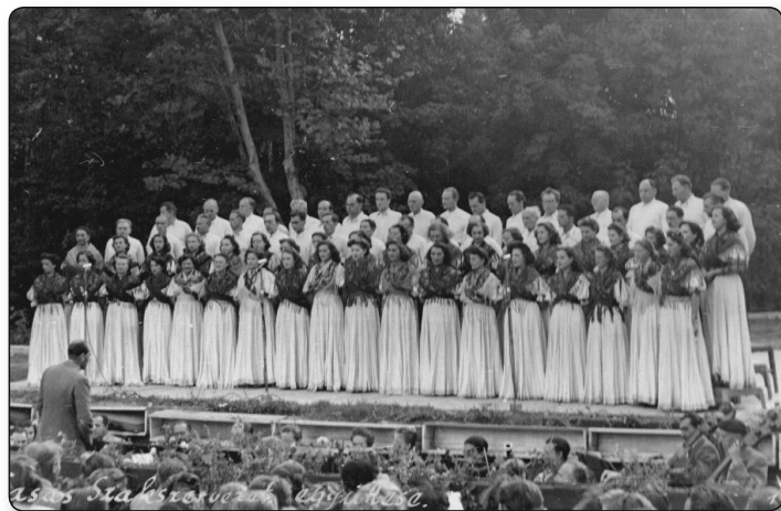
1953 Margitszigeti koncert