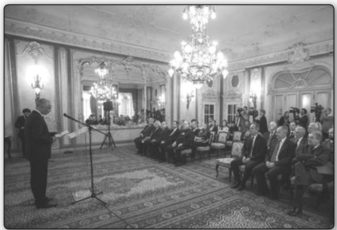
Károli Gáspár-díj átadása 2013. 10. 31.