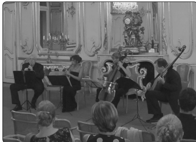
Az EXCANTO Együttes - Keszthely 2012