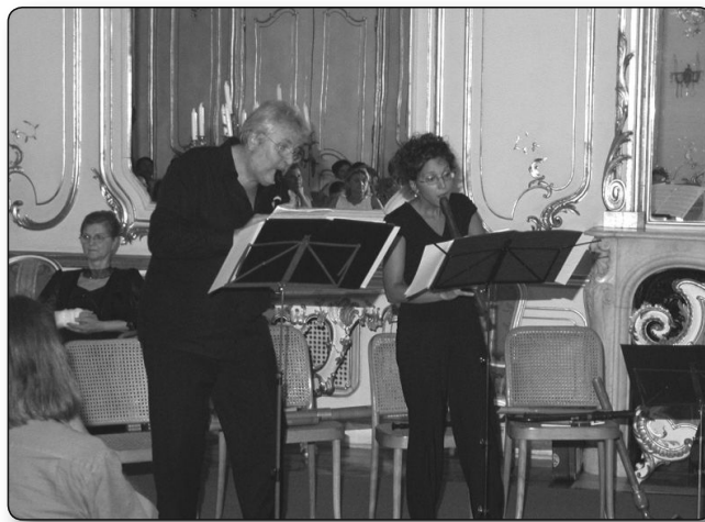
Az EXCANTO Együttes - Keszthely 2012

– Vegyük az ön példáját: ha egy személyben ennyire sokfajta zenei irányultság van jelen, lehet-e, képes-e magas színvonalat nyújtani mindegyik műfajban, műnemben, stílusban, irányzatban?