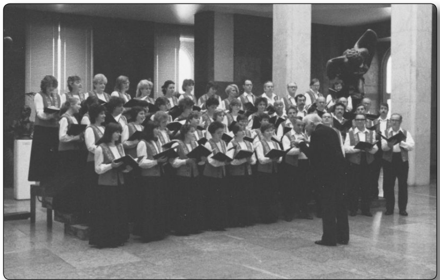
1986 Nemzeti Galéria