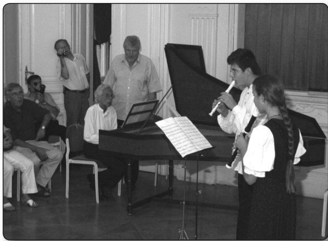
A fúvós tanítványok a zárókoncerten 2008

ezni, de ma már inkább elfogadás, befogadás jellemzi a hazai zenei életet, és összefogást érzek a régizeneszek közt is. És valljuk meg őszintén, hogy harminc-negyven évvel ezelőtt a régizeneszek nagy része azért lett régizenesz, mert elindult valamerre a zenei pályán, és ott esetleg nem ért el sikereket. A frissen indult régizenei irányzat viszont akkortájt toborozta a zenészeket, ahol könnyebben jutott lehetőségekhez. De ma már a régizeneszek is csak akkor tudnak labdába rúgni, ha a legmagasabb szintű zenei tudással rendelkeznek. Ma már egészen