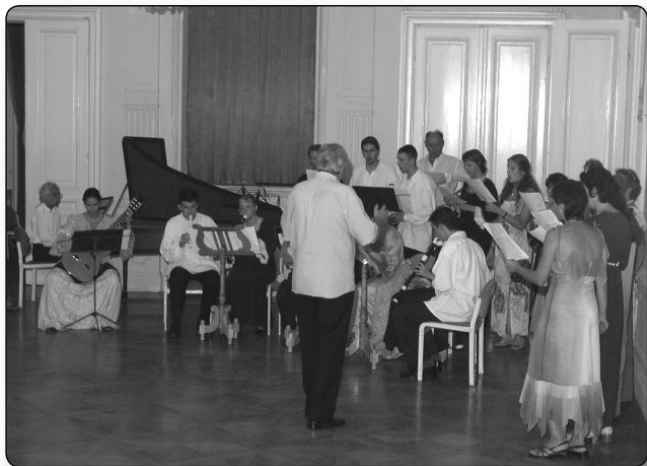
Kiskórus a zárókoncerten a Nagybálszobában 2008

ezni, de ma már inkább elfogadás, befogadás jellemzi a hazai zenei életet, és összefogást érzek a régizeneszek közt is. És valljuk meg őszintén, hogy harminc-negyven évvel ezelőtt a régizeneszek nagy része azért lett régizenesz, mert elindult valamerre a zenei pályán, és ott esetleg nem ért el sikereket. A frissen indult régizenei irányzat viszont akkortájt toborozta a zenészeket, ahol könnyebben jutott lehetőségekhez. De ma már a régizeneszek is csak akkor tudnak labdába rúgni, ha a legmagasabb szintű zenei tudással rendelkeznek. Ma már egészen