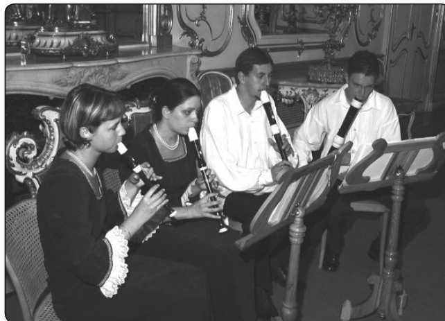
Az Ózdi LAURUM koncertje - Keszthely Tükörterem 2011

– Szóval kimondhatjuk az ön tapasztalataiból levonható következtetést: csak zenész létezik, és nincs alá- vagy fölérendelt operista, vokális vagy hangszeres, vagy régizenesz, vagy a dzsesszt játszó Cziffra György szembeállítva a klasszikus Lisztet játszó Cziffra Györggyel. E dolgok békés egymás mellett élésének ideális állapota azonban