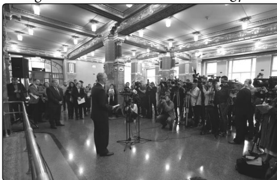
Az átadás pillanatai