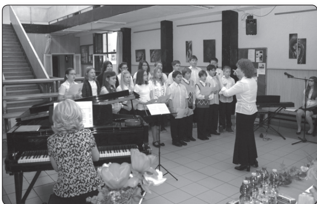
Tiszaparti Római Katolikus Általános Iskola és Gimn. Gyermekkórusa