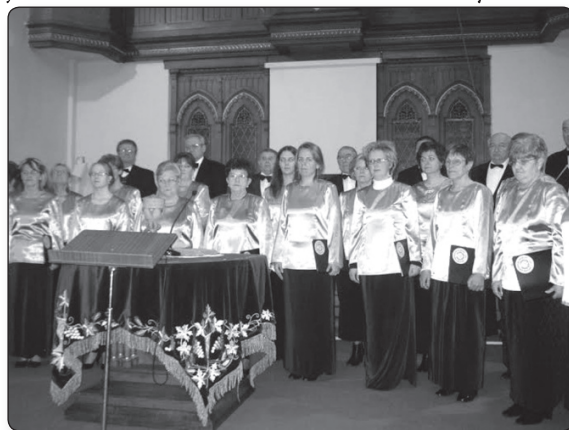
Kaposvári Zenekedvelők Kórusa

Másnap, vasárnap reggel az Együd Árpád Művelődési Központban Mindszenty Zsuzsánna a jelenlévő énekeseknek bemutatott néhány kórus-