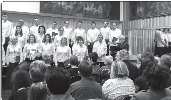
A 35 éves a Komlói Pedagógus Kamarakórus