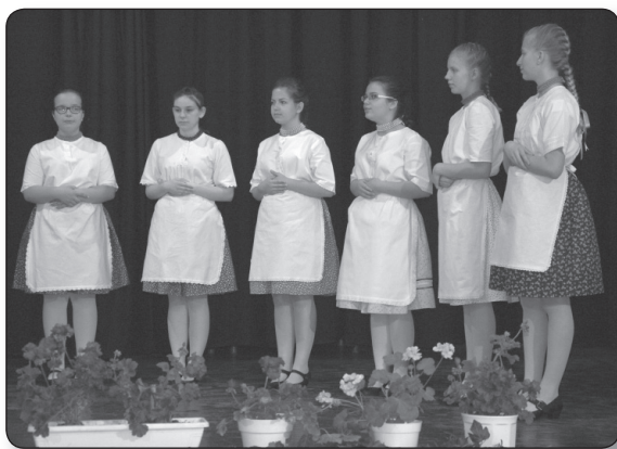
Kalácska - Kazincbarcika