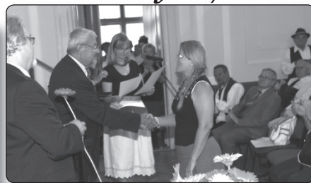
A zsűri értékeli