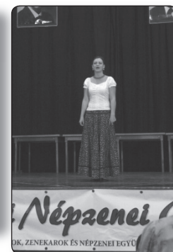
Népzenei OR. ZENEKAROK ÉS NÉPZENEI EGYSÉGEK