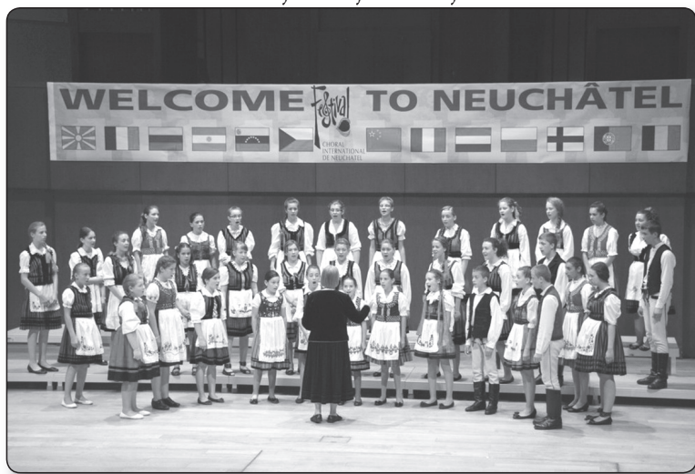
Marosszéki Kodály Zoltán Gyermekkar Szovátáról

tagjaik szeretetteljes figyelmével kísérve addig