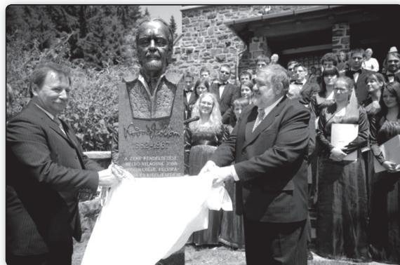
Kodály Zoltán szobrának avatása Galyatetőn

Az önkormányzati erőforrások mellett a Nemzeti Kulturális Alap köztéri szoborállítás támogatására kiírt pályázatán elnyert összegnek köszönhetően valósulhatott meg a régi terv: legyen szobra Kodály Zoltánnak Galyatetőn, ott ahol hosszú évek alatt oly sok időt töltött pihenéssel, munkával! A szobor felavatása volt a központi szervező erő, e köré épült a program többi része: az alkalomhoz méltó ünnepélyes szentmise, és annak keretében Kodály Zoltán Missa brevis című művének első galyai előadása, az Új Liszt Ferenc Ka-