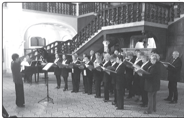
Koncert a Károlyi kastélyban

Ebéd után csatlakoztunk a nagykarolyi kórushoz, és továbbindultunk az esti koncert helyszínére. Hihetetlen élmény volt ott énekelni. A Károlyi kastély ugyanis első kirándulásunk idején még romos volt, a második ott tartózkodásunk idején már megcsodálhattuk a gyönyörűen helyreállított épületet. Most pedig ennek díszcsarnokában énekelhettünk. Ismét