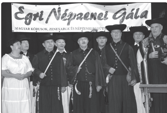
Törő Gábor Népdalkör, Püspökladány