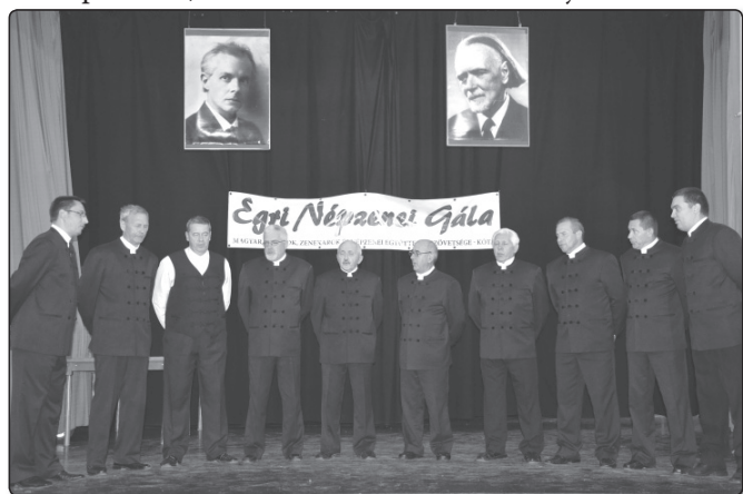
II. Rákóczi Ferenc Férfikar, Csóka