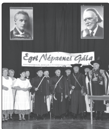
Törő Gábor Népdalkör, Püspökladány