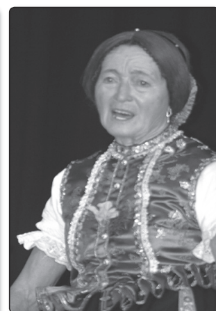
Gyöngyöstarjáni asszony énekel