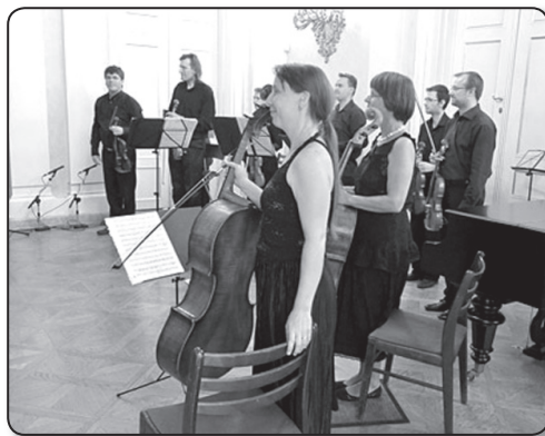
A Weiner-Szász Kamaraszimfonikusok