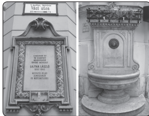
A díszkút, rajta a felirat: Lajtha Kút