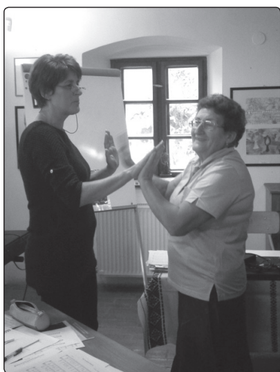
A kodályi pedagógia gyakorlati alkalmazása az iskolában

„az ének felszabadít, bátort, gátlásokból, féltékenységből kigyógyít. Koncentrál, testi-lelki diszpozíciót javít, munkára kedvet csinál, alkalmasabbá tesz, figyelemre, fegyelemre szoktat... egész embert mozgat, nemcsak egy-egy részét...kifejleszti csírájában a minden emberben