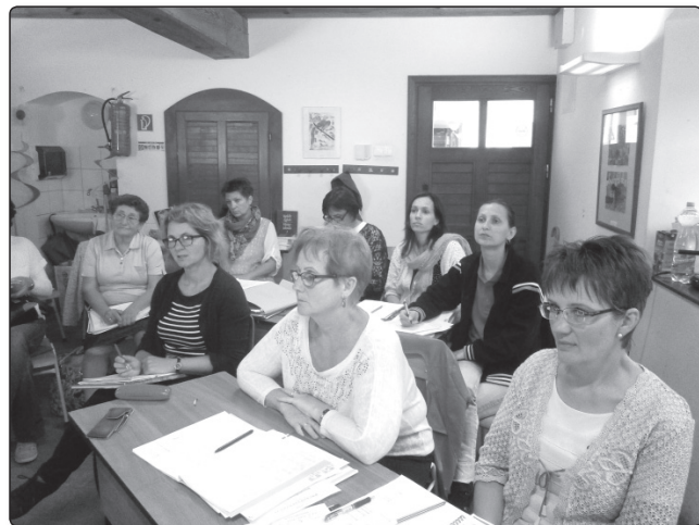
Kodály kórusműhelyében – Kórusművek, a feldolgozástól a hangversenyen elhangzó előadásukig

hadtunk–láthattunk módszertani útmutatásokat a tisztán éneklés, a hangképzés rejtelméről. Sikerült megvitatnunk, értékelnünk a szakmát foglalkoztató, napi pedagógiai munkánkat érintő legfontosabb kérdéseket, az előttünk álló legsürgetőbb feladatokat és mindezek mellé célokat tűznünk. Ilyen célok: zenei anyanyelvünk megőrzése, a klasszikus, kortárs, és színvonalas mai zenei értékek pedagógiai szempontú megválogatása és a mai diákok értékvilágába való beültetése. Ilyen aktuális feladatunk lesz az előttünk álló években a „Mindennapos éneklés” helyi bevezetése, amelynek sok nyitott kérdése és befolyásoló tényezője van, de az már látható, hogy sikeressége a mi