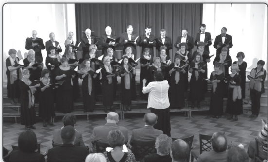
Budapesti Monteverdi Kórus