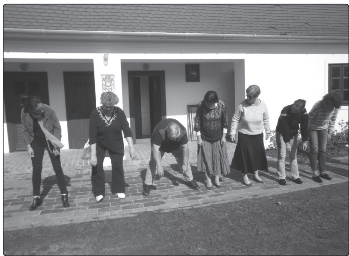
A „Mindennapos éneklés” – program tervezete, a módszertani eszközök és repertoár bővítése

meglevő zeneérzékét, ezzel megadja a műveltség alapját, amivel