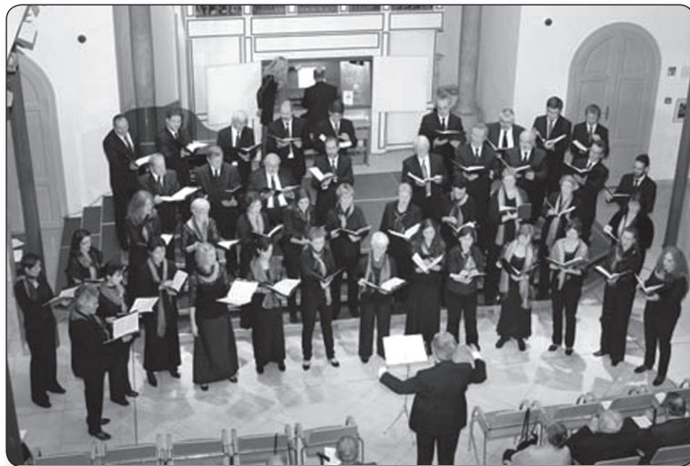
A Szekszárdi Madrigálkórus

– Belenőttem ebbe is, mint ahogy a szakmám is „rám ragadt” a hangszeres, a karvezetői és az elméleti ismeretekkel. Először 1981-ben hívtak Szekszárdra, és azóta is vezetem a Szekszárdi Madrigálkórust.