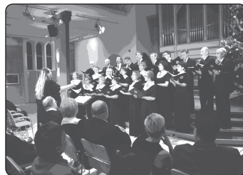
Tinódi Vegyeskar (Szigetvár)

Hát áradj ránk, forró zene, taníts az emberség dalára! Örködj szikáran ősz zenész, barátodért is pártot állva. S maradj velünk, hogy általad szeresse még e nép a sorsát; hogy nem vészett el, megmaradt a dalban-élő Magyarországot!