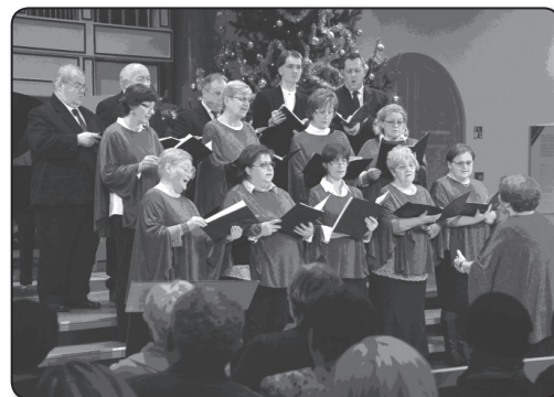
Kaposvári Református Kórus