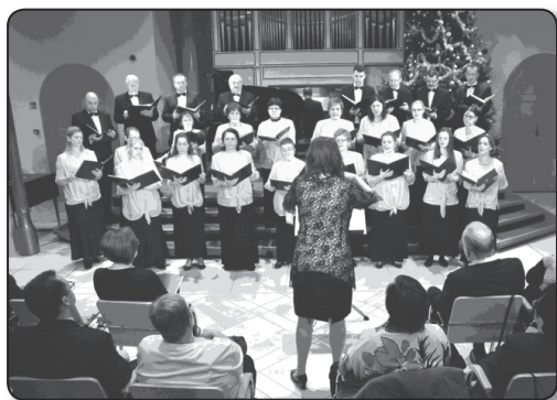
Szekszárdi Gárdonyi Zoltán Református Együttes