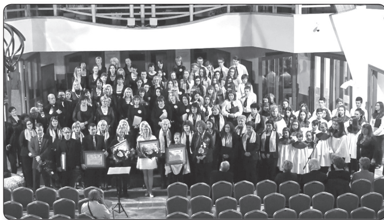
A kórustalálkozó résztvevői - Veresegyház