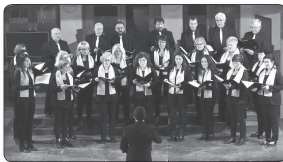
Musica Aurea Vegyeskar