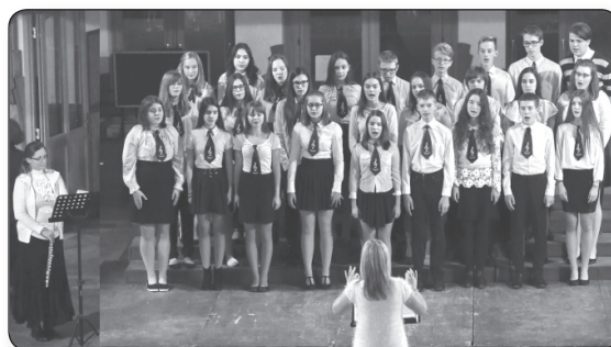
Fülemlé Gyermekkar - Veresegyház