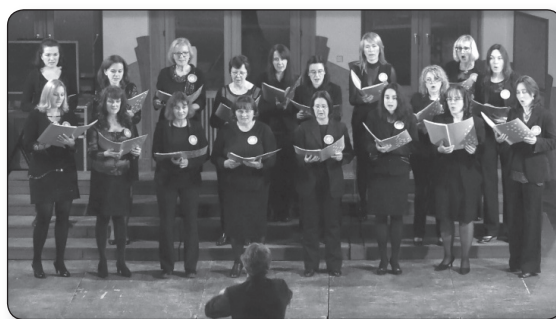
Stellaria Media Nőiakar