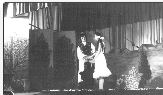
2. kép: A makrancos királylány, Veszprém 1959.

a kompozíciót, hogy azután a színpadra állításával koronázza meg veszprémi tanáréveit. 2. kép.