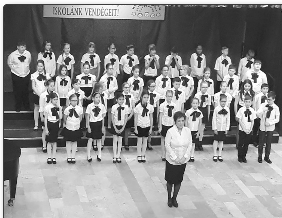
Kicsinyek Kórusa Kodály Z Ált Isk. és AMI Tatabánya