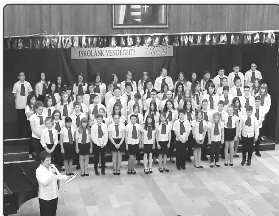
Kodály Kórus Kodály Z Ált Isk. és AMI Tatabánya

karvezető, mesterpedagógus, szervező a KÓTA Ifjúsági- és Zenepedagógiai Szakbizottságának tagja