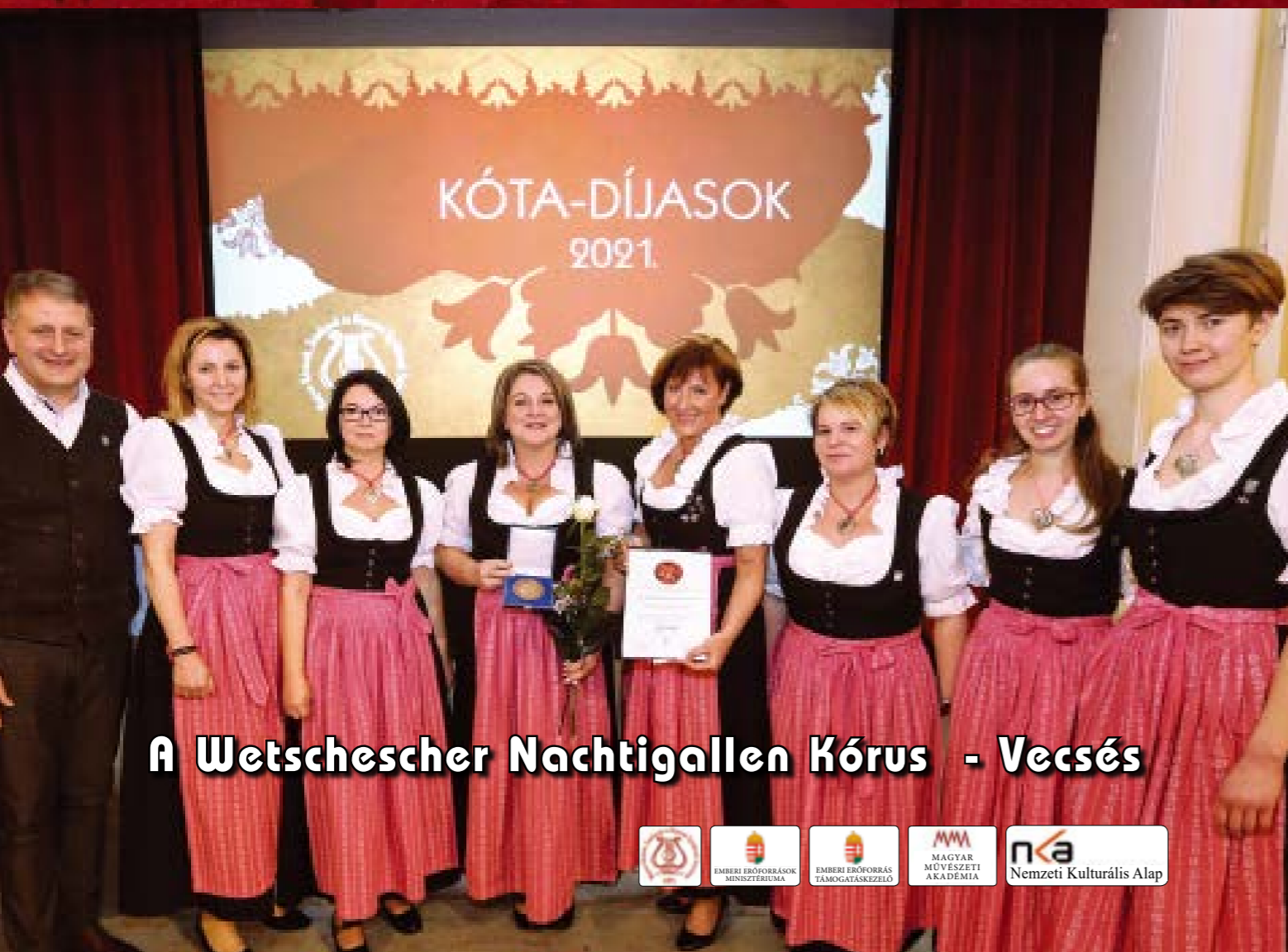
A Wetschescher Nachtigallen Kórus - Vecsés