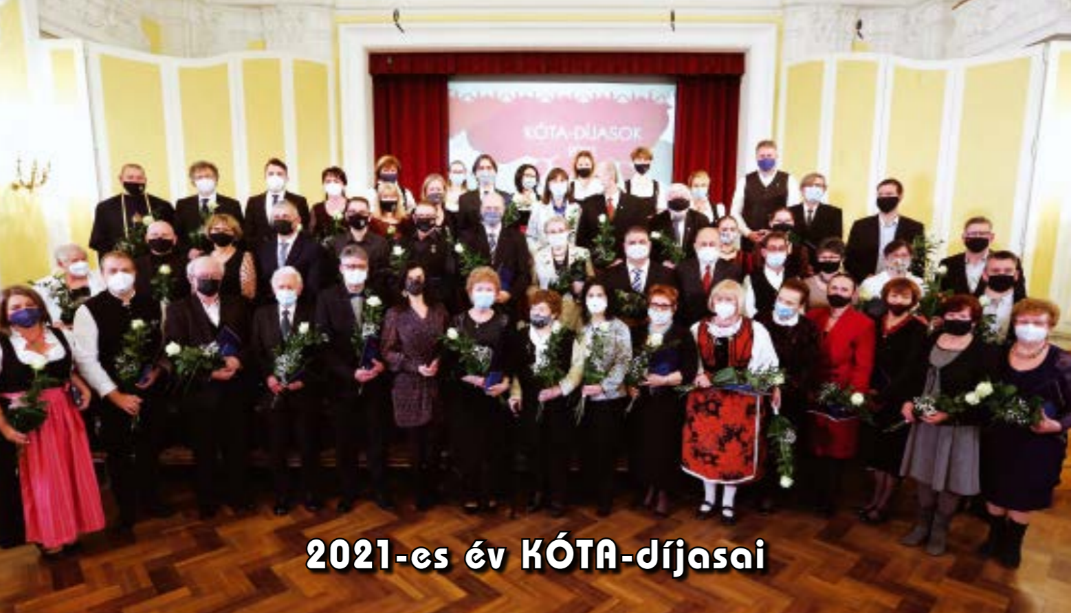
2021-es év KÓTA-díjasai