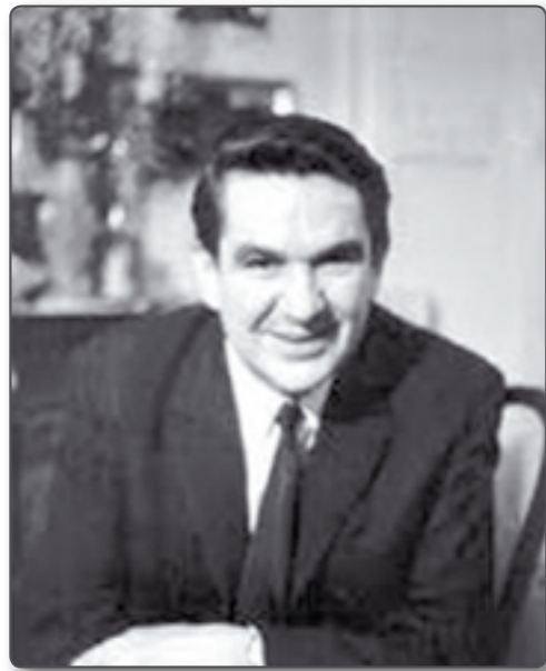
Lantos Rezső Liszt-díjas karnagy (Mekényes, 1927. március 26. - Budapest, 1977. február 10.)