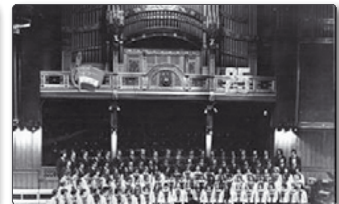
Lantos Rezső és a legendás Központi Kórus az énekkar fennállásának 25. évfordulója alkalmából rendezett zeneakadémiai koncerten (1975)