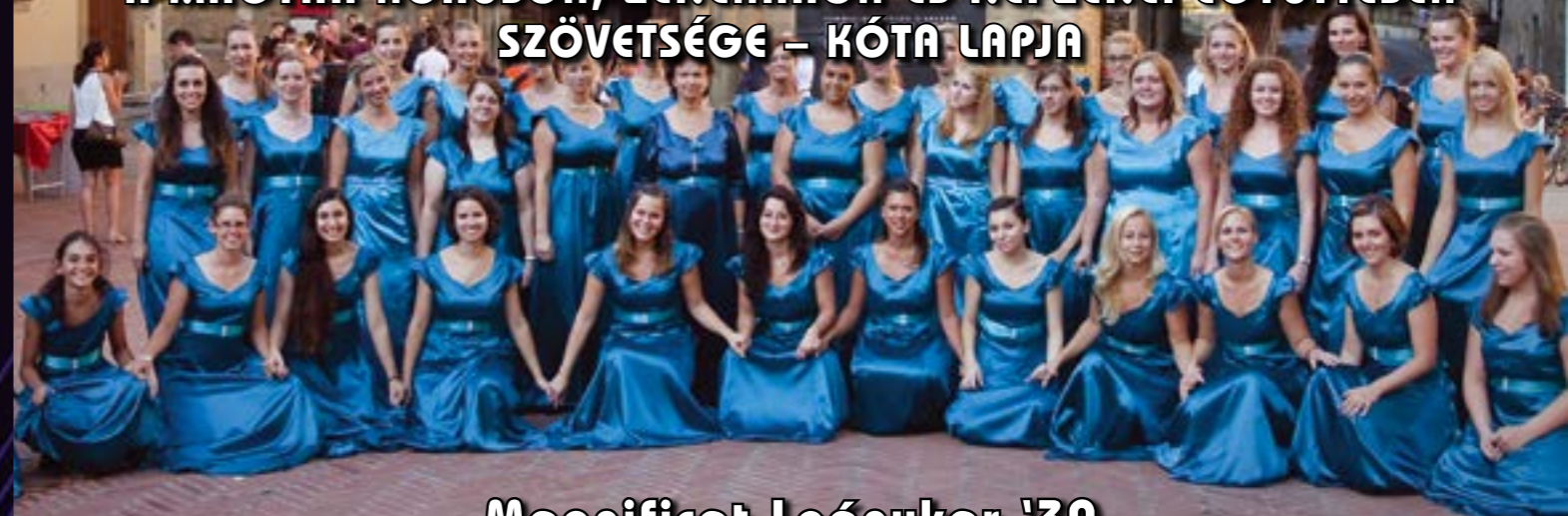
Magnificat Leánykar '30

A MAGYAR KÓRUSOK, ZENEKAROK ÉS NÉPZENEI EGYÜTTESEK SZÖVETSÉGE – KÓTA LAPJA