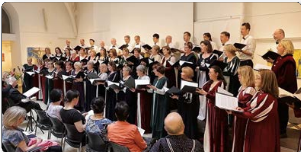
Jubileumi hangverseny 2022.05.08. Szép3-terem