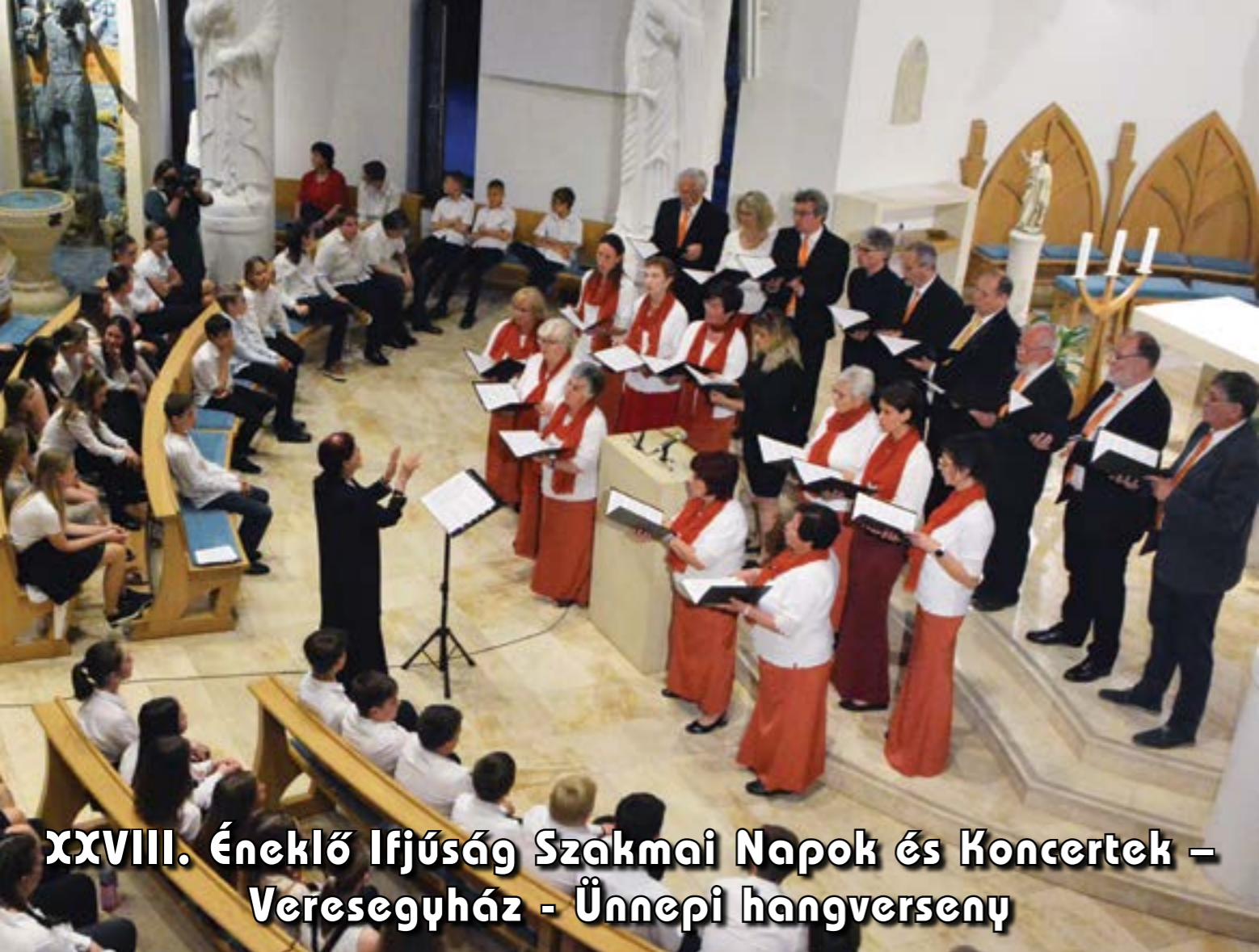
XXVIII. Éneklő Ifjúság Szakmai Napok és Koncertek – Veresegyház - Ünnepi hangverseny