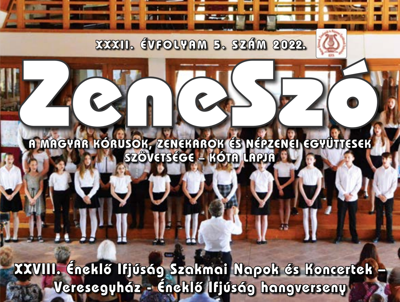
XXVIII. Éneklő Ifjúság Szakmai Napok és Koncertek – Veresegyház - Éneklő Ifjúság hangverseny