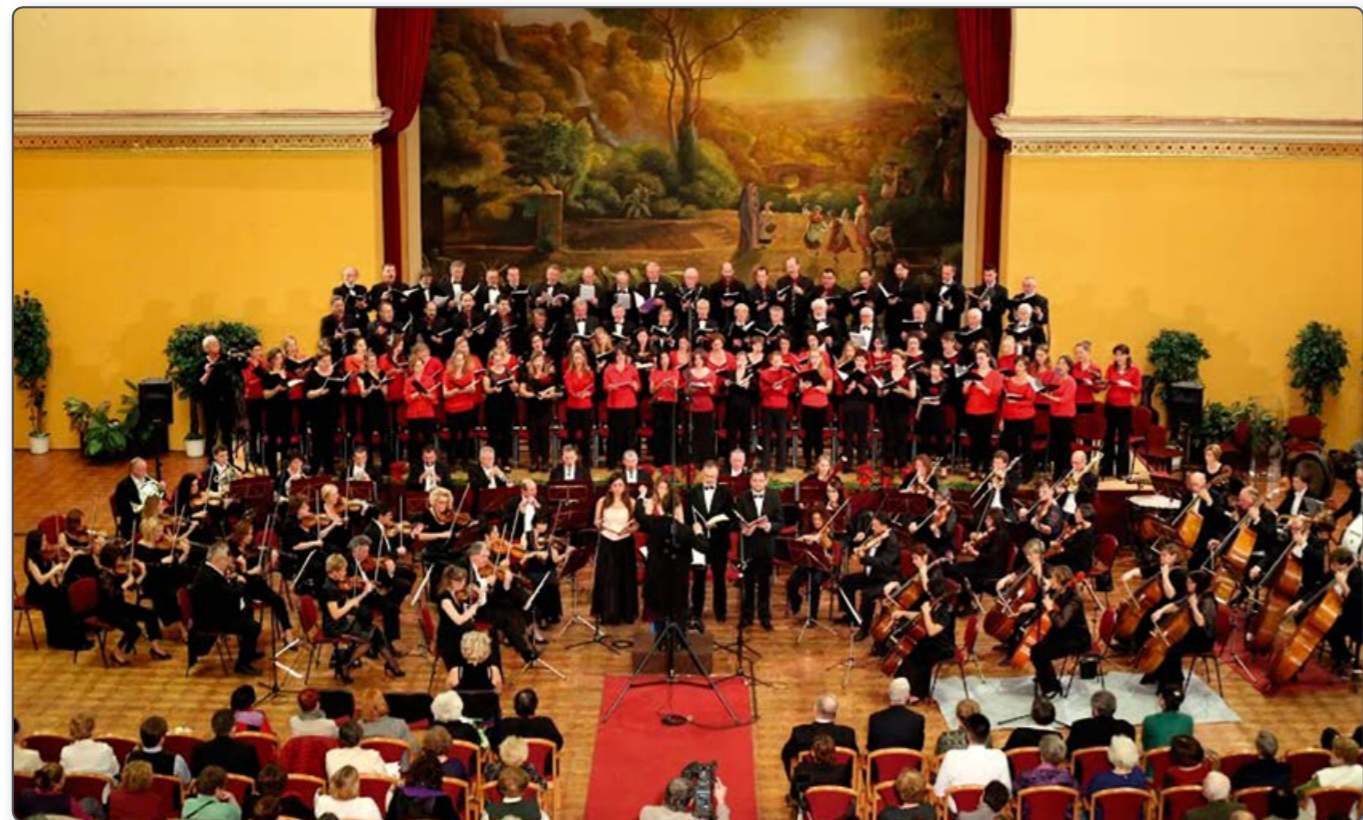
Kodály Zoltán VII. Magyar Kórusverseny nyitóhangversenye, 2015. november 19. Budapesti Olasz Intézet

A KÓTA szakbizottságai közül az 1990-es átalakulás óta az Ifjúsági és Zenepedagógiai Bizottságnak különlegesen fontos szerepe volt. A jövő kulturált társadalmának felnevelése, ízlésének, igényeinek kialakítása, kreativitásának fejlesztése az iskolában történik. Eppen ezért a KÓTA 14 tagú, különféle iskolatípusokat képviselő Ifjúsági Szakbizottsága naprakész információkkal, az illetékesekkel való kapcsolatok kiépítésével, és folyamatos munkával igyekszik az iskolai tanítás,