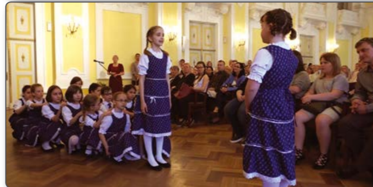
„Angyalkert” hangverseny Kodály Zoltán tiszteletére, népszokásokat megidéző kórusműveiből

illetve az ifjúsági kórusok ügyeit jó irányba befolyásolni.