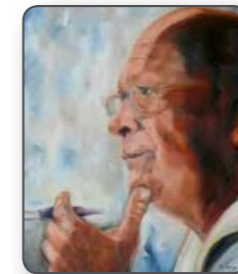
Géczy Olga festménye

Mindenki így hívta, mint a címben szerepel, de azt nem tudom, hogy ő erről tudott-e. A mi évfolyamunk volt az utolsó, akiket diplomáztatott. Három pillanatot idézek föl emlékeimből, mely ezt a korszakot jellemezte.