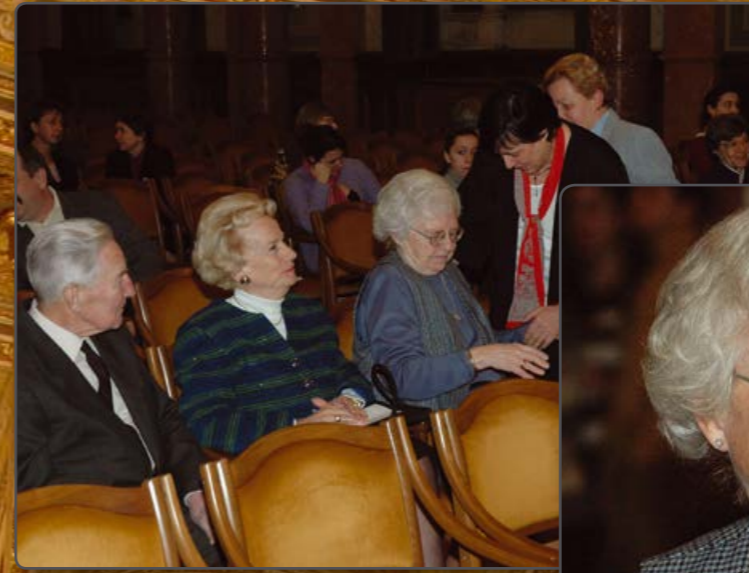
Gyülekezik a közönség