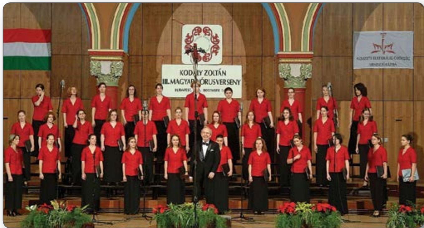
A Bárdos Leánykar (2003)